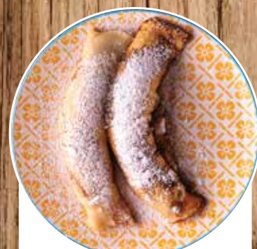
БЛИНЫ С ПРИПЕКОМ ИЗ ТЫКВЫ 240/40 ГР 250 ИЗ ЯБЛОКА 240/40 ГР 250