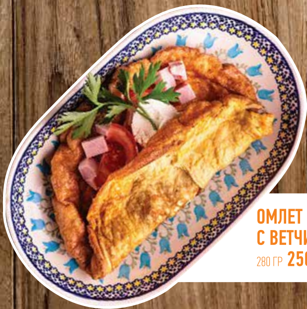
ОМЛЕТ С ВЕТЧИНОЙ И СЫРОМ