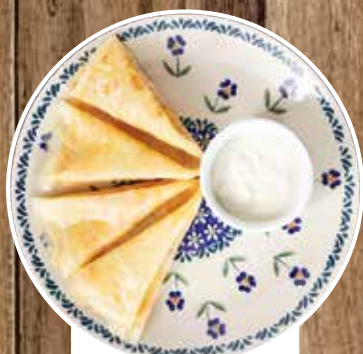
БЛИНЫ СО СМЕТАНОЙ