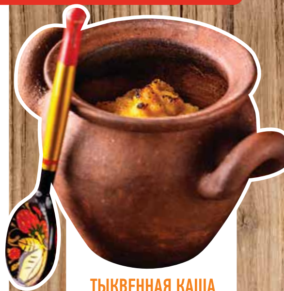
ТЫКВЕННАЯ КАША С ЯБЛОКОМ И МЕДОМ